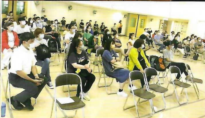
7月11日 洪水橋天主教崇德英文書院（彌撒中心）首祭