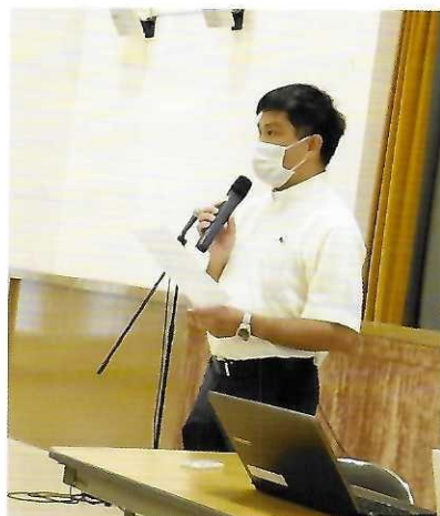
7月1日 禮儀培育日 疫情下對聖事禮儀的 再認識